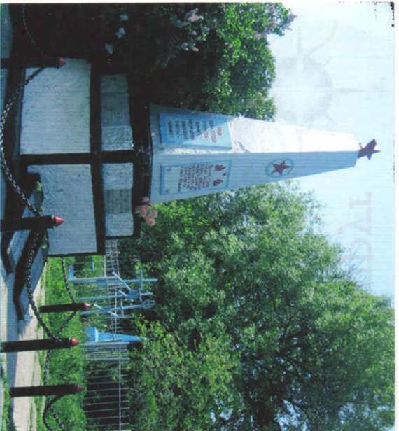
МУНИЦИПАЛЬНОЕ КАЗЕННОЕ УЧРЕЖДЕНИЕ ДОПОЛНИТЕЛЬНОГО ОБРАЗОВАНИЯ «ЦЕНТР ИСТОРИКО-ЮНОШЕСКОГО ТУРИЗМА И КРАЕВЕДЕНИЯ МАЛГОБЕЖСКОГО МУНИЦИПАЛЬНОГО РАЙОНА» СВМЕСТНО С ПОИСКОВЫМ ОТРЯДОМ «МАЛГОБЕК»