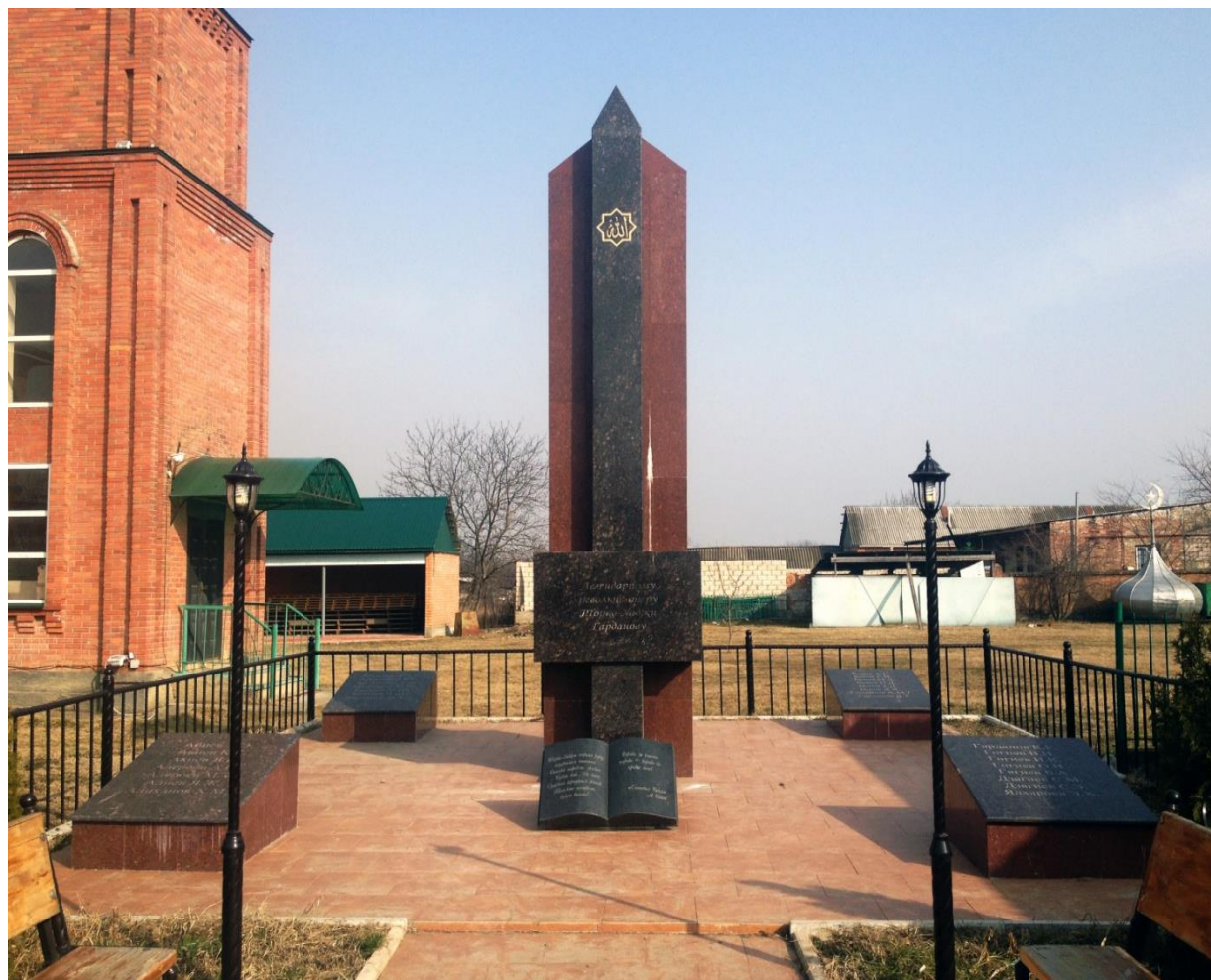
Памятник Тарко-Хаджи Гарданову