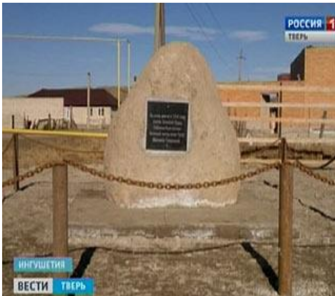
Памятный знак в честь Князя Тверского