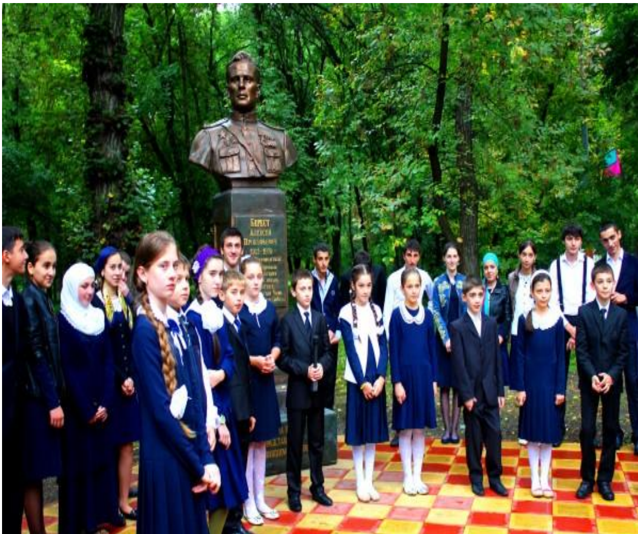
Памятник Бересту А.П.