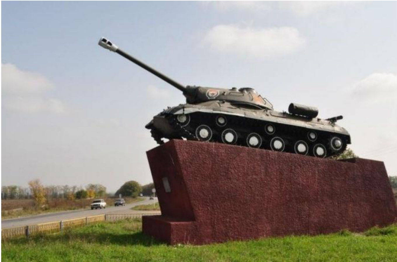
Танк-Памятник в честь 52 ОГТБ