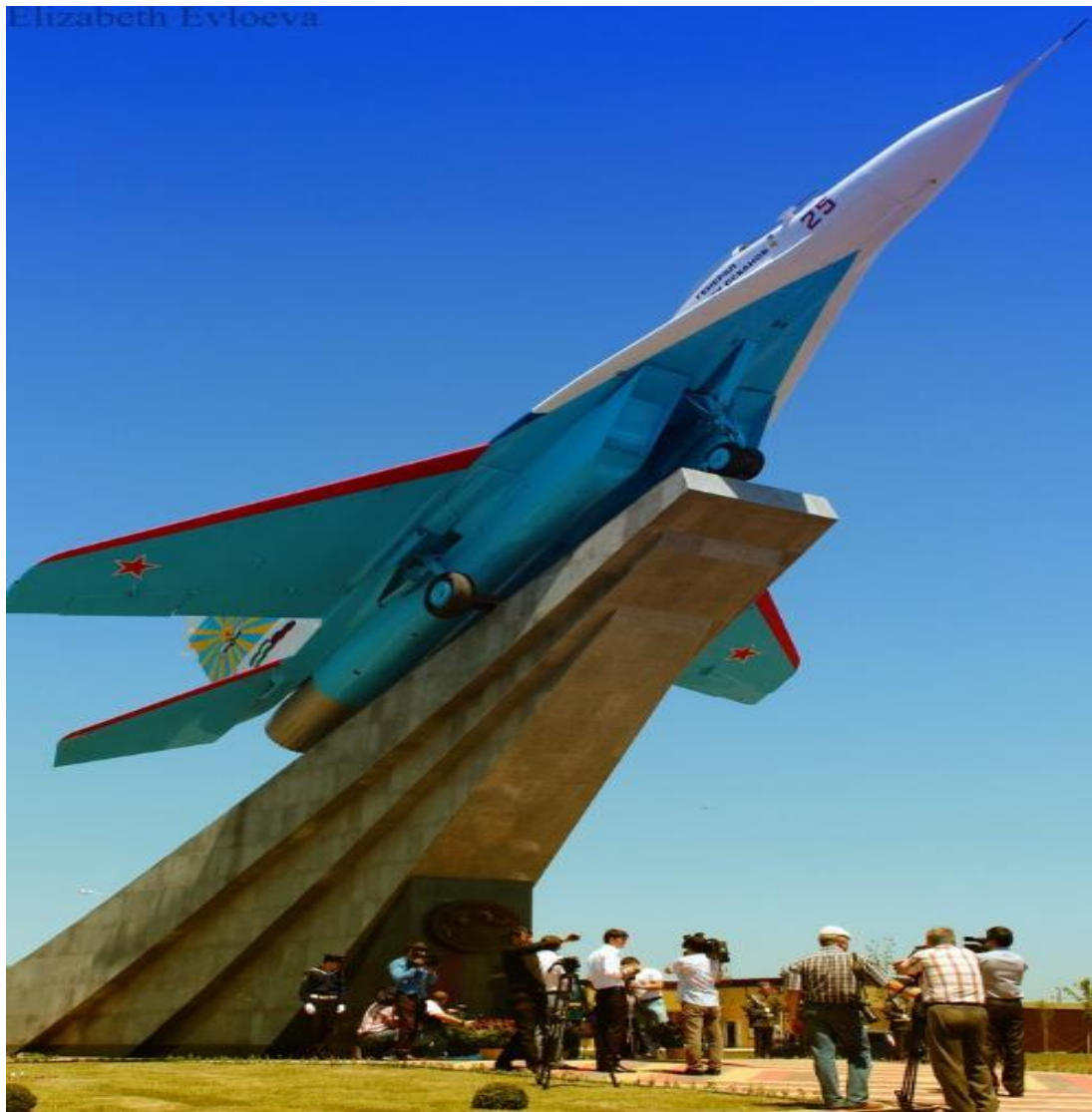
Памятник первому герою России С.С.Осканову самолет МИГ-29.