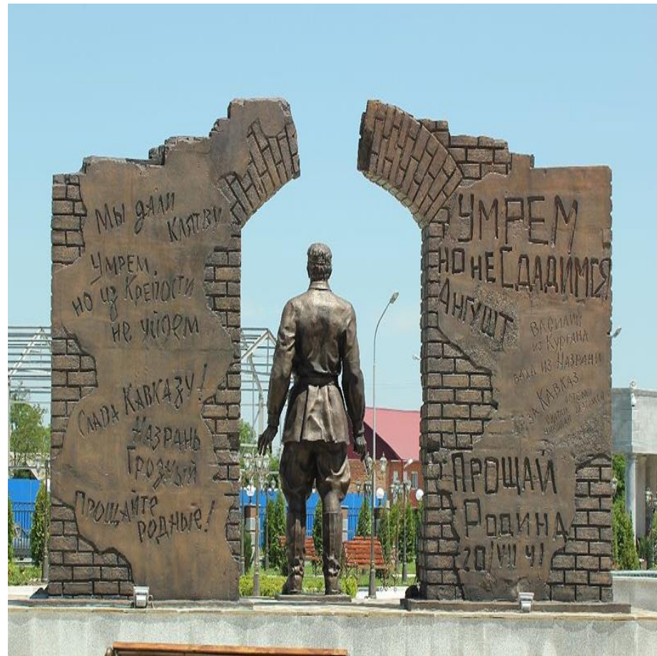
Памятник Барханову У.А.- одному из последних защитников Брестской крепости