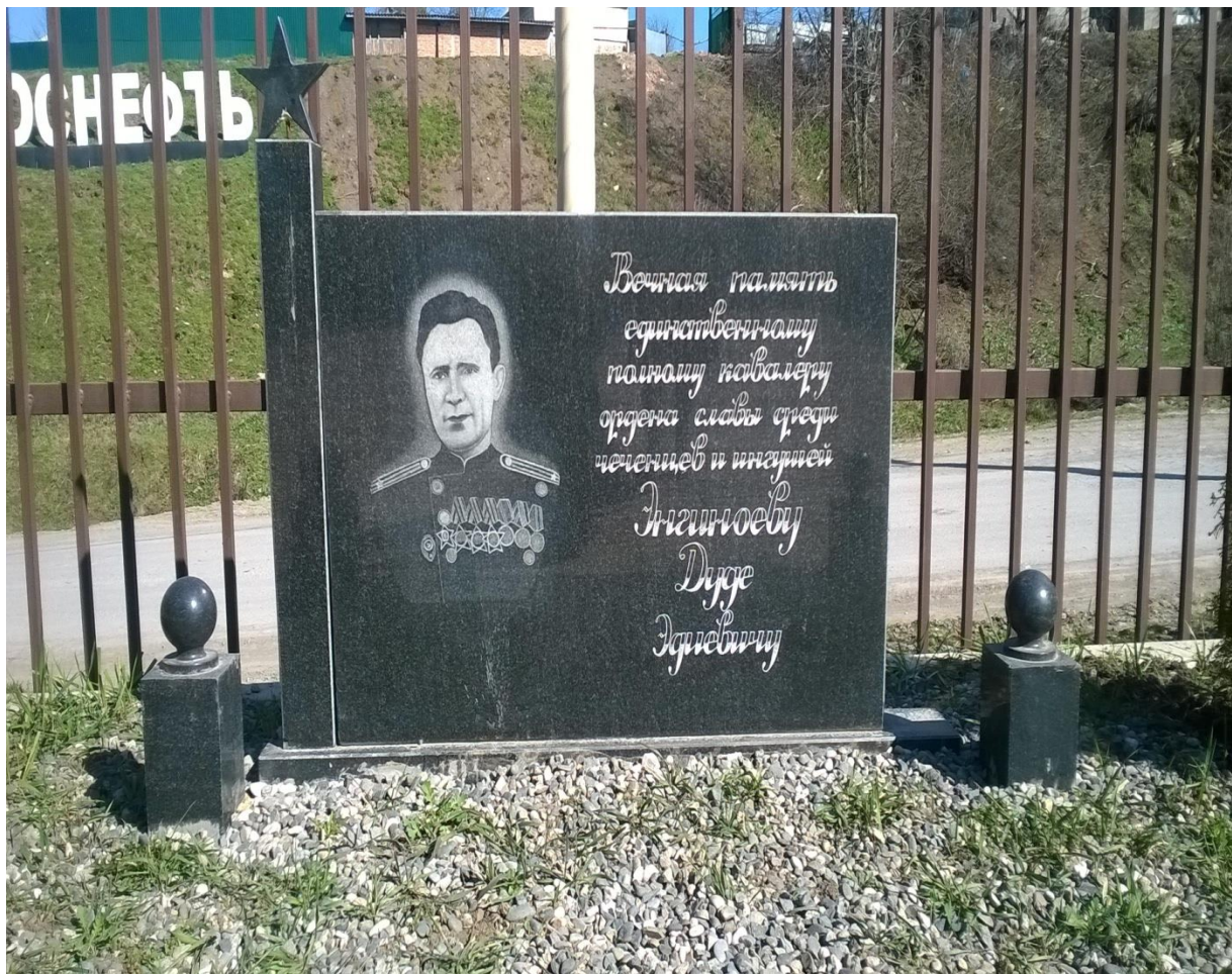
Памятник Энгиноеву Д.Э.